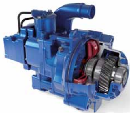
O novo retarder a água da Voith disponível de fábrica com código B3H.